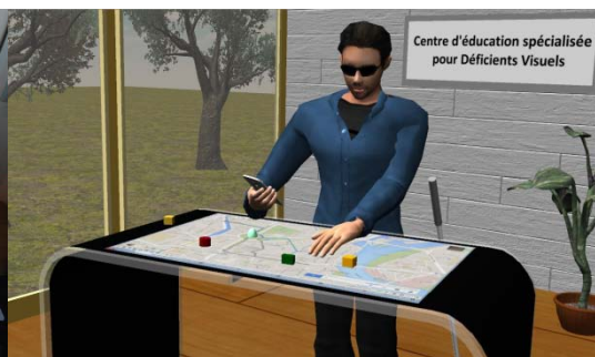
AccessiMap : prototype de carte tangible et collaborative